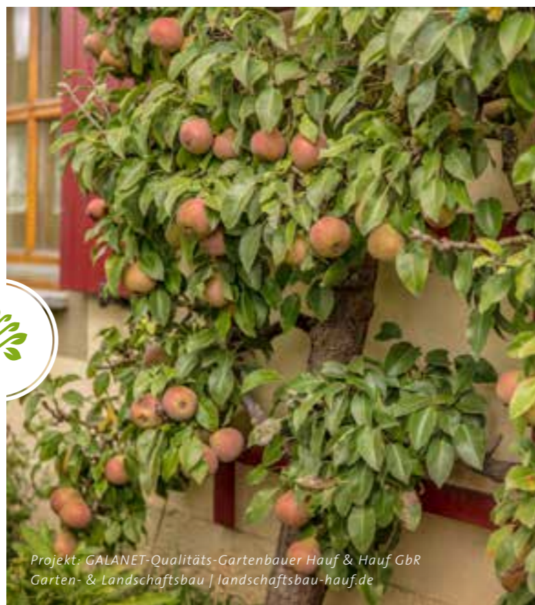
Projekt: GALANET-Qualitäts-Gartenbauer Hauf & Hauf GbR Garten- & Landschaftsbau | landschaftsbau-hauf.de