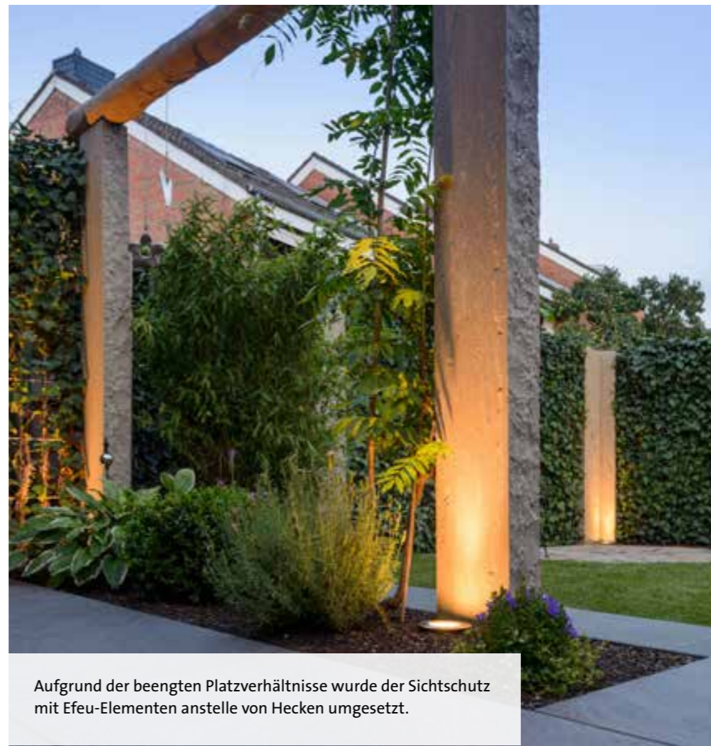
Aufgrund der beengten Platzverhältnisse wurde der Sichtschutz mit Efeu-Elementen anstelle von Hecken umgesetzt.

Falko Werner Garten- und Landschaftsbau GALANET-Partner seit 2005