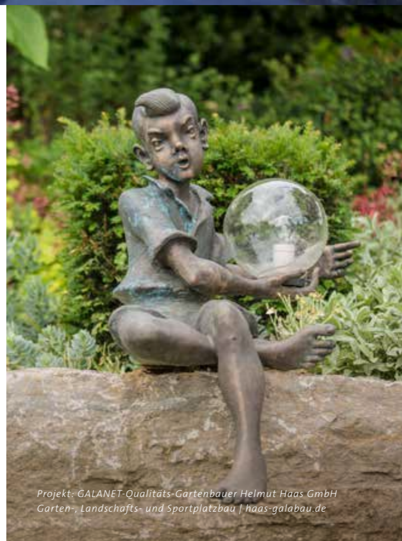
Projekt: GALANET-Qualitäts-Gartenbauer Helmut Haas GmbH Garten-, Landschafts- und Sportplatzbau | haas-galabau.de

Um Ihren Garten auch nach Einbruch der Dunkelheit weiter strahlen zu lassen, muss nicht die gesamte Fläche beleuchtet werden. Perfekt geplant und fachmännisch umgesetzt, tanzen Licht und Schatten leichtfüßig über Grünflächen, Blumenbeete, Terrassen und Wasseroberflächen.