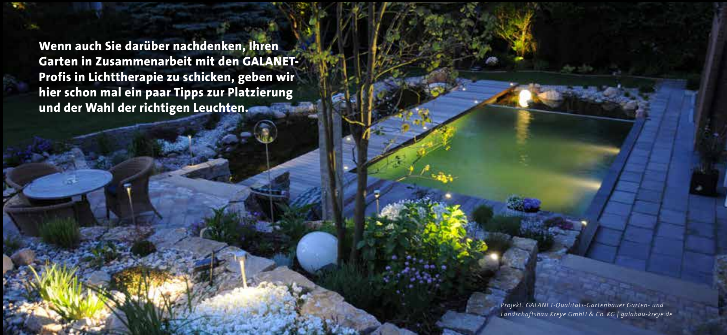
Projekt: GALANET-Qualitäts-Gartenbauer Garten- und Landschaftsbau Kreye GmbH & Co. KG | galabau-kreye.de

Wenn auch Sie darüber nachdenken, Ihren Garten in Zusammenarbeit mit den GALANET-Profis in Lichttherapie zu schicken, geben wir hier schon mal ein paar Tipps zur Platzierung und der Wahl der richtigen Leuchten.