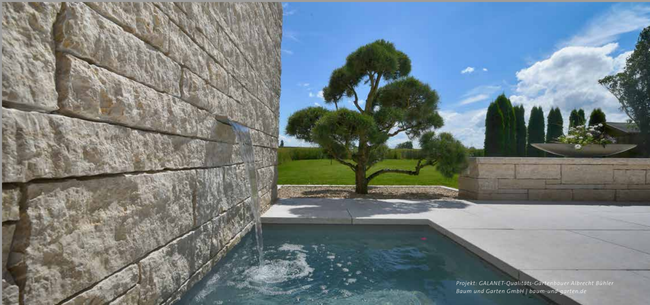
Projekt: GALANET-Qualitäts-Gartenbauer Albrecht Bühler Baum und Garten GmbH | baum-und-garten.de

Eine weitere Verwendungsmöglichkeit für Steine im Garten sind Mauern. Häufig dienen sie als Begrenzungen, die vor störenden Geräuschen und Blicken von der Straße schützen, können aber auch innerhalb des Gartens verschiedene Bereiche voneinander abtrennen und in unterschiedliche Höhen terrassieren. Von Gabionen oder niedrigen Mauern umrandete Hochbeete bringen Obst- und Gemüsepflanzen oder blühende Rabatten auf Augenhöhe. Sehr beliebt sind auch Trockenmauern, bei denen Zwischenräume frei bleiben, anstatt mit Mörtel aufgefüllt zu werden. Hier finden Eidechsen und andere Gartenbewohner Unterschlupf.