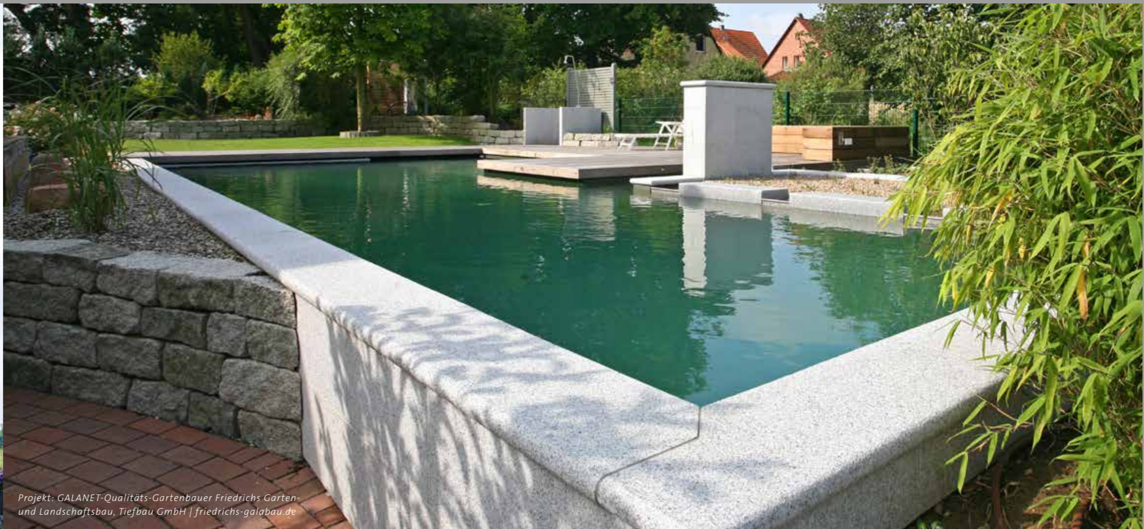
Projekt: GALANET-Qualitäts-Gartenbauer Friedrichs Garten- und Landschaftsbau, Tiefbau GmbH | friedrichs-galabau.de