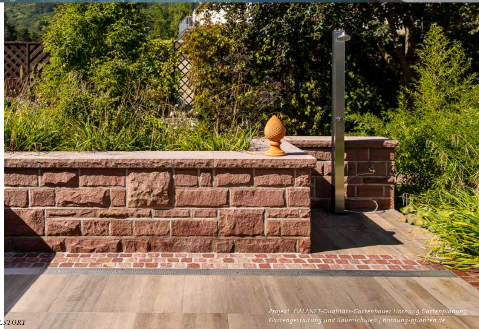
Projekt: GALANET-Qualitäts-Gartenbauer Hornung Gartenplanung, Gartengestaltung und Baumschulen | hornung-pflanzen.de

Ob man Beton- oder Naturstein verwendet, ist letztlich jedem selbst überlassen. Klassischerweise wird die Terrasse eher mit Natursteinplatten gebaut und funktionelle Flächen wie eine Garageneinfahrt mit Betonstein gepflastert. Beide Materialien können auch miteinander kombiniert werden – zum Beispiel, wenn in einem Weg aus Betonsteinpflaster in regelmäßigen Abständen Bänder aus Naturstein gelegt werden.