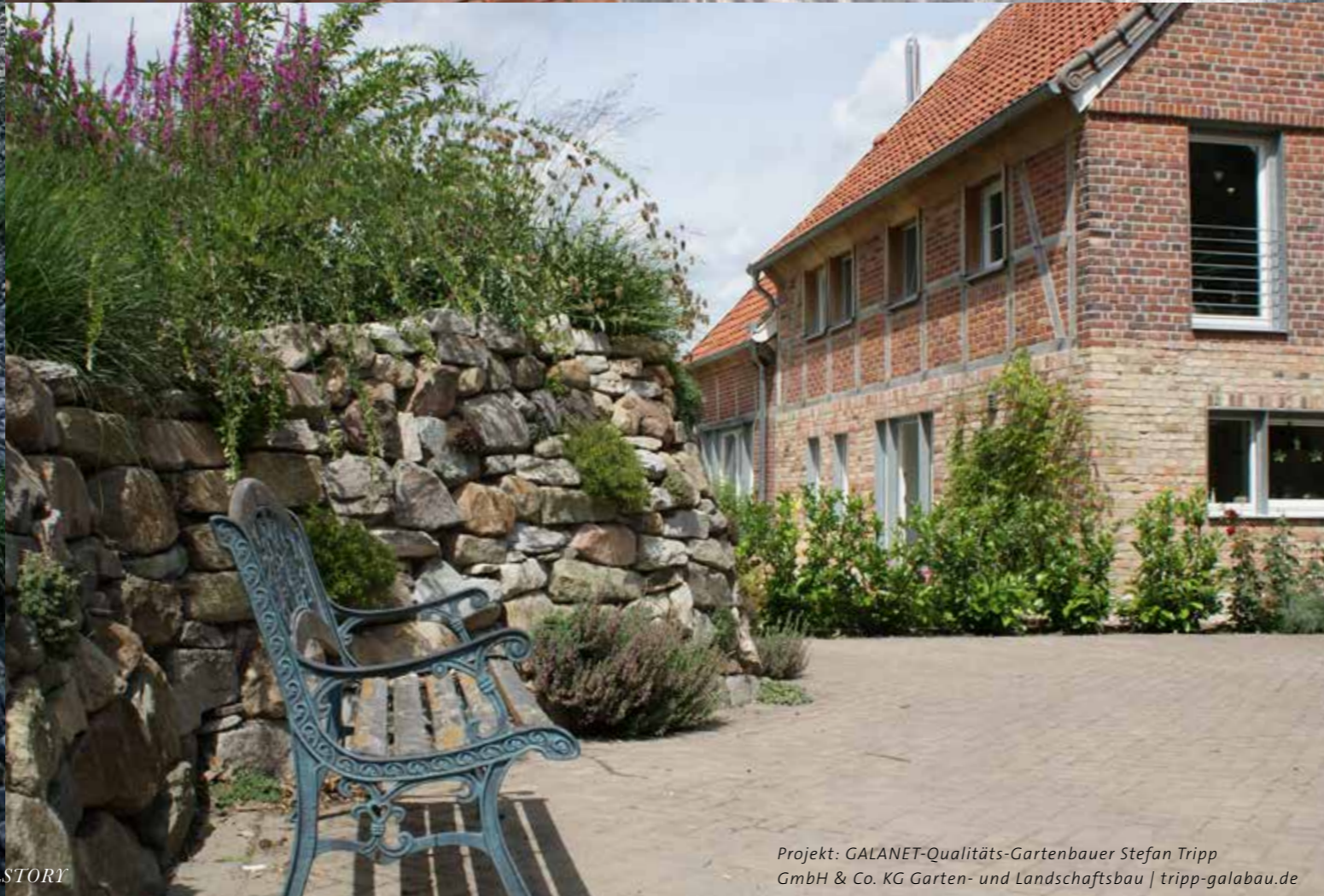
Projekt: GALANET-Qualitäts-Gartenbauer Stefan Tripp GmbH & Co. KG Garten- und Landschaftsbau | tripp-galabau.de