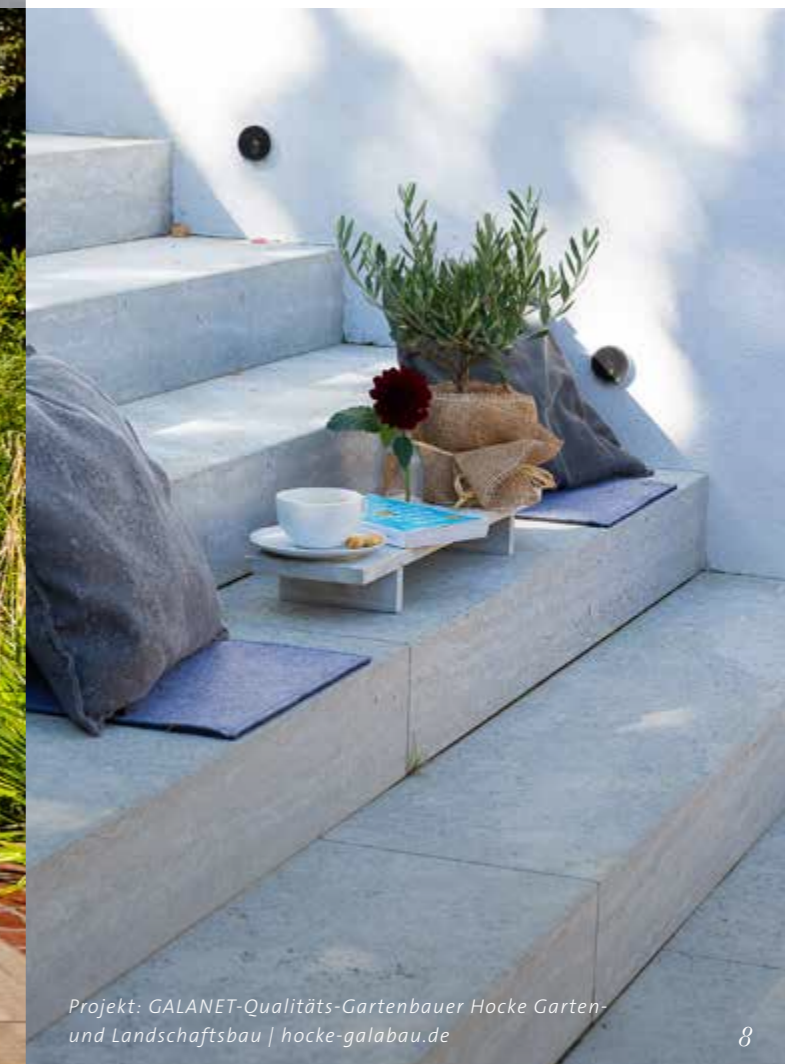
Projekt: GALANET-Qualitäts-Gartenbauer Hocke Garten- und Landschaftsbau | hocke-galabau.de