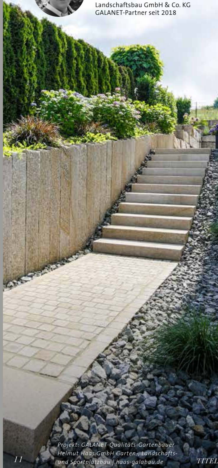
Projekt: GALANET-Qualitäts-Gartenbauer Helmut Haas GmbH Garten-, Landschafts- und Sportplatzbau | haas-galabau.de

TERWIEGE Garten- und Landschaftsbau GmbH & Co. KG GALANET-Partner seit 2018