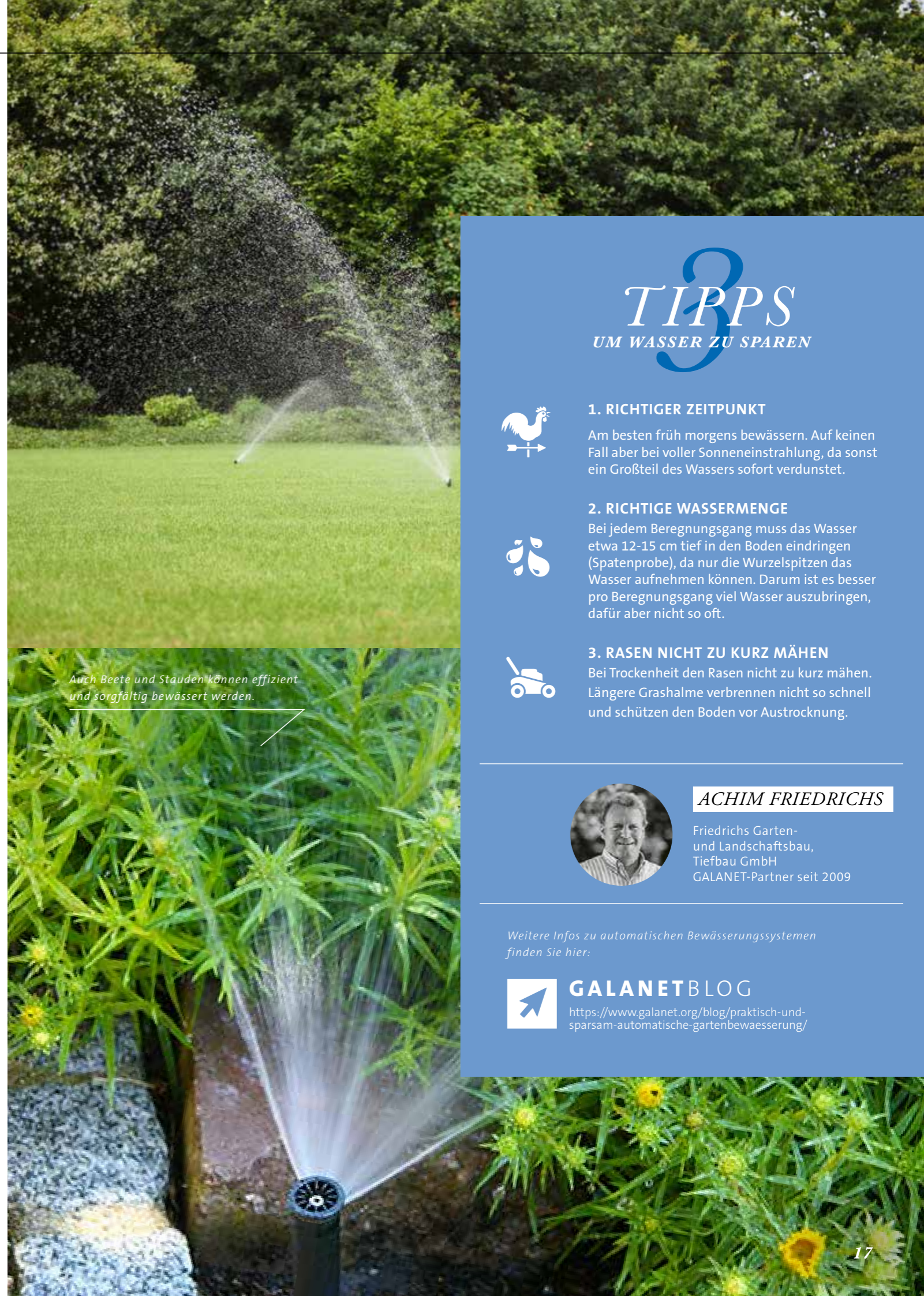
Auch Beete und Stauden können effizient und sorgfältig bewässert werden.

Vegetationsflächen zu bewässern ist sehr zeitaufwendig und kann von Hand niemals so genau und sorgfältig erledigt werden, wie mit einem automatischen System. Durch eine professionelle Planung und einen fachmännischen Einbau der Bewässerungsanlage, werden die unterschiedlich dimensionierten Versenkregner mit Wasser- und Steuerungsleitungen miteinander verbunden. Über die Steuerungstechnik wird dann die Vegetation mit genau so viel Wasser versorgt, wie nötig. Der Rasen dankt es Ihnen mit sattem, gesundem Grün, bei gleichzeitiger Einsparung von wertvollem Wasser.