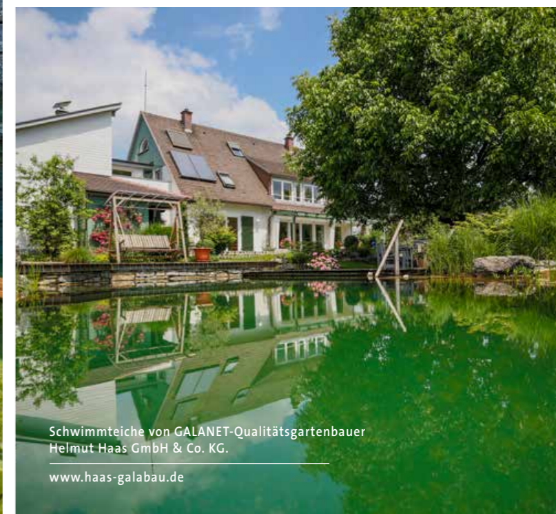
Schwimmteiche von GALANET-Qualitätsgartenbauer Helmut Haas GmbH & Co. KG.