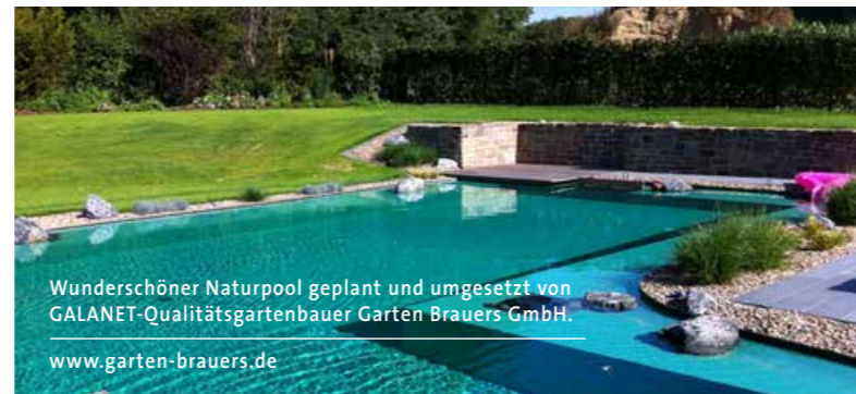
Wunderschöner Naturpool geplant und umgesetzt von GALANET-Qualitätsgartenbauer Garten Brauers GmbH. www.garten-brauers.de

Ein Naturpool benötigt im Gegensatz zum Schwimmteich keinen Regenerationsbereich mit Wasserpflanzen. Somit kann die komplette Fläche des Naturpools zum Baden genutzt werden.